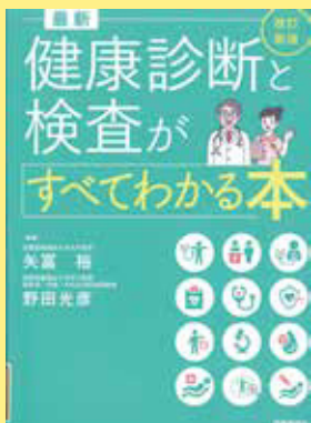
『最新健康診断と検査 がすべてわかる本 改訂 新版』 矢富 裕／編著 時事通信出版局 2024

A 『最新 健康診断と検査がすべてわかる本 改訂新版』が便利です。検査内容、基準値、 基準値を外れているときに疑わ れる病名などがわかりやすく解 説されています。亜鉛について は、「鉄や銅などとともに生体 内必須微量元素と呼ばれるミ ネラルで、牡蠣、レバー、う なぎ、牛肉、卵黄、チーズ、 アーモンド、カシューナッツ、 抹茶、ココアなどに多く含まれ る」と説明されています。また、 鉄や亜鉛が欠乏するとあらわ れる症状についても紹介されて います。