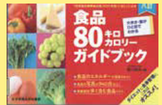
『八訂食品 80 キロカロリーガイ ドブック』香川 明夫／編 女子栄 養大学出版部 2022

厚生労働省のデータによると、 平均寿命と健康寿命の差は男 性で 8.49 年、女性で 11.63