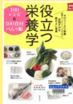
『役立つ栄養学 100 レ シピ & 500 食材べんり帳』 主婦の友社／編 主婦の友社 2018

レシピについては、『役立つ栄養学 100 レシピ & 500 食材べんり帳』に「ミネラルを効率よくとる常備菜」とい う章があり、汁物や煮物など日常的に取り入れやすいレ シピが掲載されています。