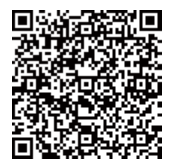
▲昭和の堺市 HPはこちら

このたびHPにて、同展を再現するデジタル郷土資料展「昭和の堺市」を公開いたしましたので、ぜひご覧ください。