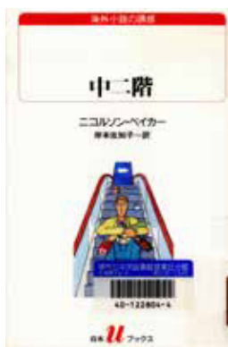
『中二階』 ニコルソン・ペイカー／著 白泉社 1997

ところで、どうしてこんな毒にも薬にもならない話をしているかというと、この場を借りて紹介したい本というのが『中二階』というタイトルで、その内容というのが、実に毒にも薬にもならない内容だからです。昔、初めて本屋でこの本を見つけたとき、ポップに「マイクロ小説」と書いてあったのですが、なるほど上手い表現だと感心したものです。私がこの小説のことを説明しようとしたら、世界一短い行き来帰りの物語、とか主人公より牛乳パックの開け口の方が印象に残る、とか書いてしまって、だれにも手に取ってもらえないに違いありません。それが「マイクロ小説」といわれたら格好いいし、気になるじゃないですか。そこでこの場で