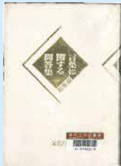
『言葉に関する問答集』 文化庁／編集 大蔵省印刷局 1995

A そもそもこの「ヶ」という字は何なのでしょう。『言葉に関する問答集 総集編』（文化庁／編集 大蔵省印刷局）によると、「この「ヶ」は片仮名ではなく、漢字の「个」（箇と同字）又は「箇」のタケカムリの一つを採ったものが符号的に用いられてきたもの」とあり、片仮名の「ヶ」と同じ形ですが、違う文字であるとしています。