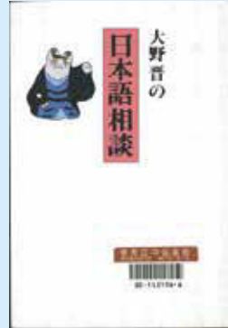
『大野晋の日本語相談』 大野 晋／著 朝日新聞社 2002

「ヶ」の起源について他の資料を見てみると、『日本国語大辞典』（小学館）や『広辞苑』（岩波書店）は「个」説を採る一方で、『大野晋の日本語相談』（大野 晋／著 朝日新聞社）では「「个」が、奈良時代あるいは平安時代のはじめころの日本人が書い