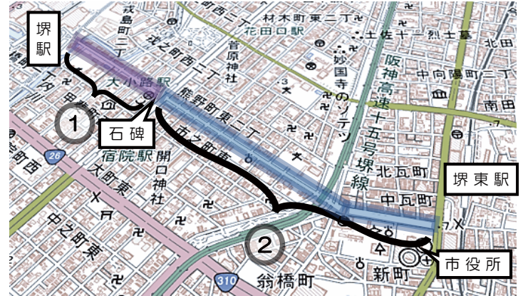
国土地理院ウェブサイト (maps.gsi.go.jp) をもとに加工

現在の大小路は以前は大阪府の管轄であり、石碑のある大道筋から西側の南海堺駅までが府道堺停車場線(地図①)、大道筋から東側の堺市役所前交差点までが府道天王寺堺線(②)として管理されていました。しかし、昭和35年(1961年)に東側(②)が堺市に移管され、続いて昭和54年(1979年)に西側(①)も堺市に移管され、