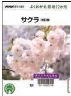
『サクラ』 船越亮二 / 著 NHK 出版 2014

「NHK 趣味の園芸」の「よくわかる栽培 12 か月」シリーズのうちの 1 冊です。早咲き、遅咲き、二期咲きなど、開花時期で品種が紹介されているページがあります。写真もそれぞれ掲載されているので、時期から見分けるのにも便利です。