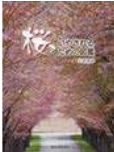
『桜でいやされるための図鑑』 大真信彦 / 著 誠文堂新光社 2017