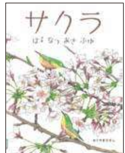
『サクラ』おくやまひさし / 作 ほるぷ出版 2022