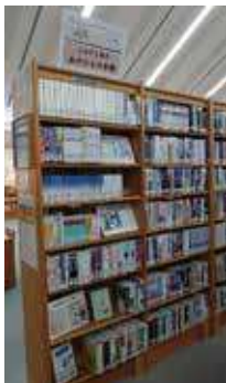
ふるさと西区 あの人の本棚

西区ゆかりの作家 山崎豊子氏（作家・故人）、久坂部羊氏（作家・医師）、江南亜美子氏（書評家）の著作や評論、書評で紹介された本を展示しています。あの人の本棚をのぞいてみませんか？