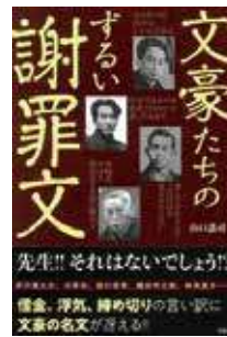
『文豪たちのずるい謝罪文』山口 謠司 / 著 宝島社 2020