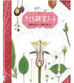
『さくら研究ノート』 近田文弘 / 著 偕成社 2017