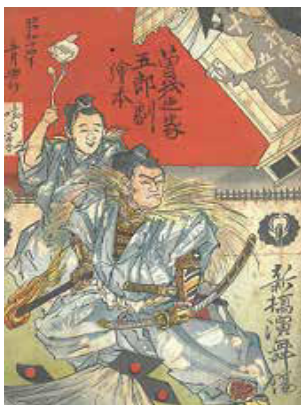
曾我廼家五郎劇絵本 プログラム 昭和14年5月1日初日 新橋演舞場

プログラム中の「一堺莊漫筆」と題した文章に、五郎が脚本を書く時のペンネーム「一堺漁人」について記述があります。大正4年に新富座で上演した狂言を見た偉いお役人から、曾我廼家の脚本を提出しろと呼び出されます。作者は誰だと問われ私ですと答えましたが、ファンの方には立派な先生が蔭に…と伝えていた手前、脚本家の名前に曾我廼家五郎と書けません。何とかほかに筆名をと考えているとお役人が五郎の俳優鑑札を見て、その表面に明記してある本籍地の堺市と本名の和田久一を接ぎ合わせて「堺一」作とせよと命令されましたが、帰宅してから「一堺」と勝手に改めたそうです。