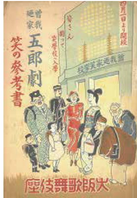
曾我廼家五郎劇 笑の参考書 プログラム 昭和11年4月1日初日 大阪歌舞伎座