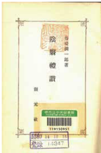
創元社 1939.12 ※堺市立中央図書館内で閲覧可能

陰翳という視点を持つことで、日常の様々な風景を普段と違った見方ができるのではないのでしょうか。ぜひ、一度この本を手に取り、自然光が生み出す美を探し、陰翳に思いを馳せてみるのはいかがでしょうか。（M.Y.）