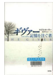
『ギヴァー 記憶を注ぐ者』