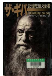
『ザ・ギバー 記憶を伝える者』

邦訳の2冊の表紙を見比べてみると、どちらもこの作品の世界観が良く出ていますが、全く違う本のような感じです。旧訳の方は実在の画家の写真ですが、まさに「ザ・ギバー」そのものです。対して、新訳の絵はジョーナスの世界と言えそうです。作品のどこを見るかで違ってくるのでしょうか。文章も旧訳の方は骨太でがっしりとしていて、新訳は今の時代に合った読みやすい文章になっています。どちらを選ぶかは好みで。読み比べてみるのも面白いと思います。(K)