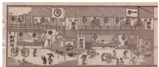
↓(右)御宿潮湯生魚 料理 一力