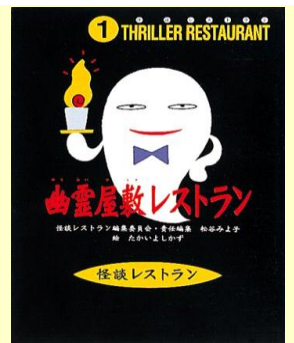
子どもたちにも大人気の『怪談レストラン』シリーズ(童心社)