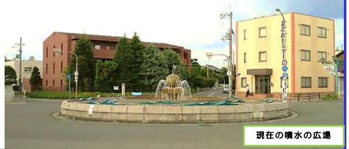
現在の噴水の広場