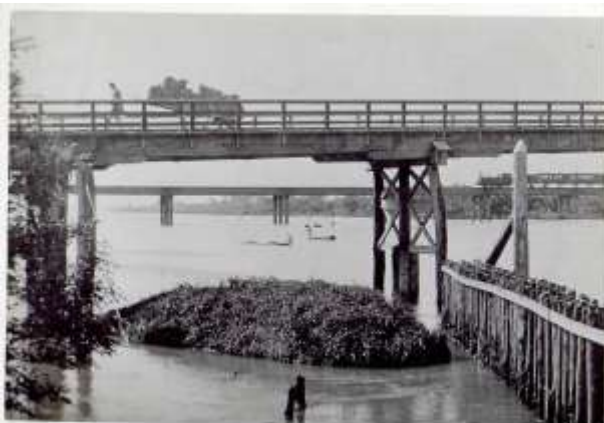
明治時代の 大和橋

事件当時の大和橋については、『大阪の橋』（松籟社）、『八百八橋物語』（松籟社）、『大阪の橋ものがたり』（創元社）、『摂津名所図会』（臨川書店）から、設置当時から移動していないことが読み取れるため、事件当時の大和橋も、現在の堺区と大阪市住之江区をつなぐ、紀州街道筋に位置していたと考えられます。