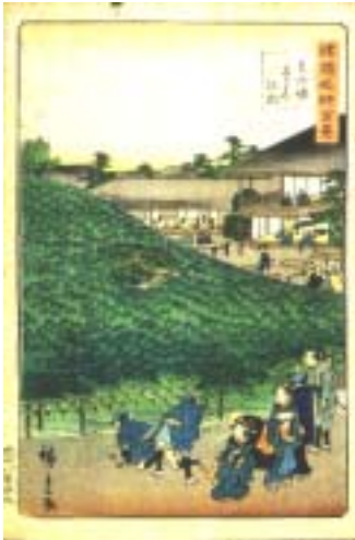
『泉州堺なにわの松』 (中央図書館蔵)

住吉大社は、江戸時代の大和川付け替え以前は堺と地続きであったため、「堺の住吉」として、堺の人々の信仰を集めてきました。海を守る神とされ、境内には堺の漁業者や商人の名が刻まれた灯籠が現在も多数残っています。