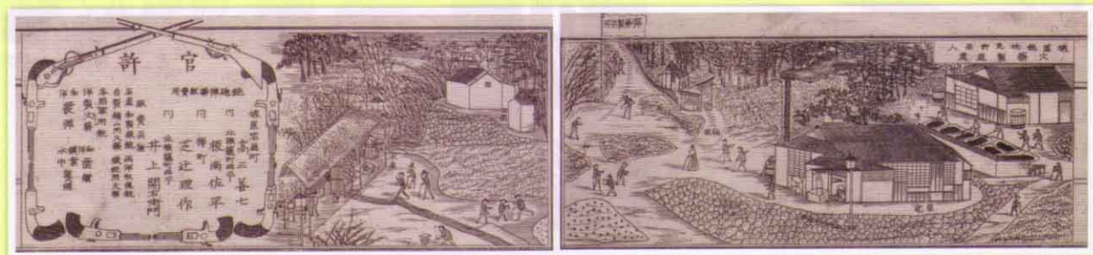
『住吉堺名所并豪商案内記』川嵯源太郎著 明治16年刊