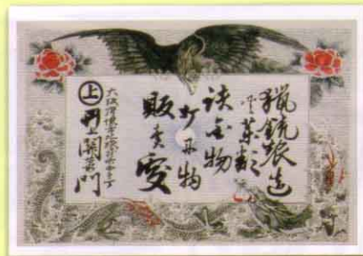
引札(猟銃製造井上関右衛門)