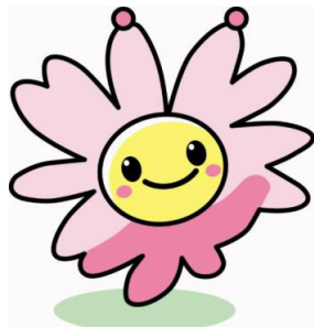
みみちゃん (南区マスコットキャラクター)