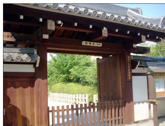
(写真上) 地藏菩薩坐像