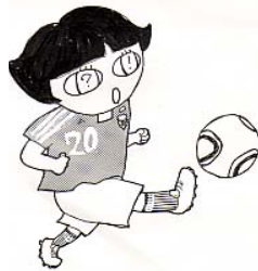
（答＝ISL：アイスランド ISR：イスラエル）

『ボールのひみつ』（新星出版社）には、サッカーボールのデザインの変遷や、2006年ドイツワールドカップや北京オリンピックで使われた14枚のパネルを熱接合したボールについて、わかりやすく解説されています。